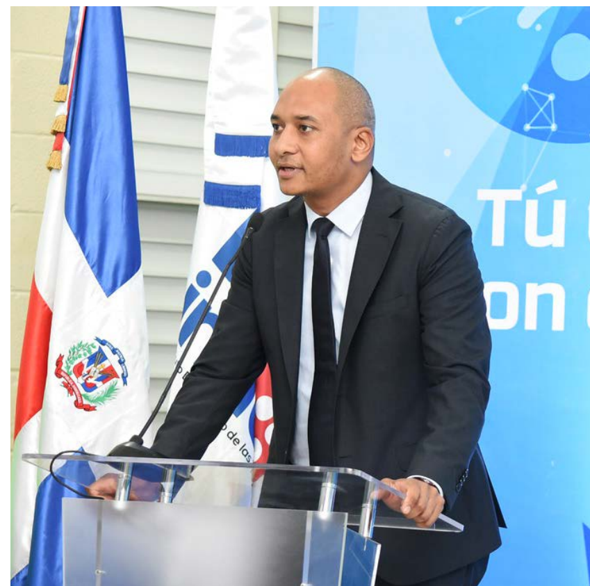
Nelson José Guillén Bello, presidente de Indotel, trabaja con una agenda de trabajo, marcada por las siguientes prioridades: organizar el espectro y sentar las bases para que las empresas puedan empezar lo antes posible con el despliegue del 5G en República Dominicana, “que es lo que va a permitir que República Dominicana continúe un camino firme hacia la cuarta revolución industrial”.